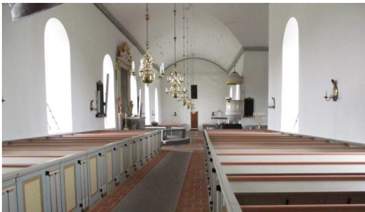
VÄSTRA KARUPS KYRKA